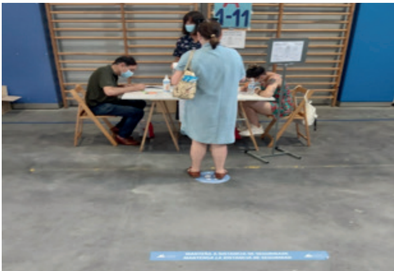
Centros de Votación en Vigo – Galicia