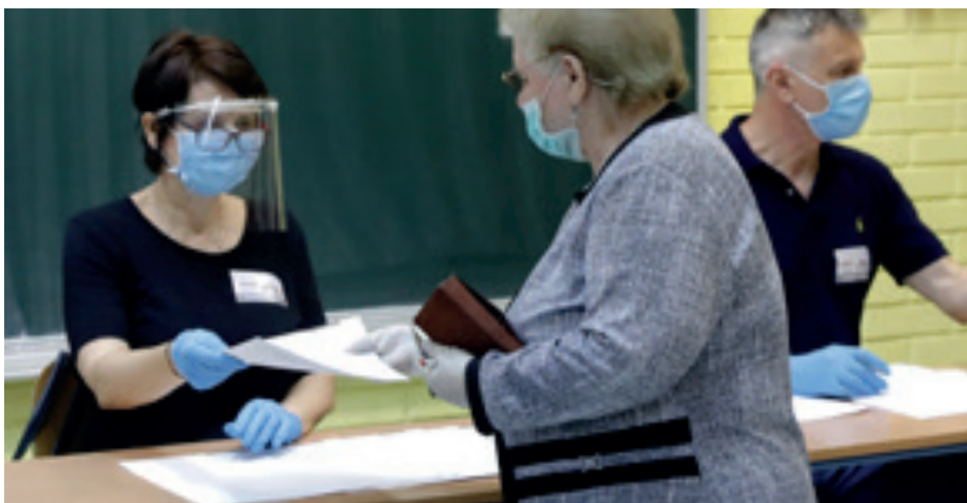
Los funcionarios electorales verifican las tarjetas de identificación de los votantes durante las elecciones parlamentarias croatas. 7