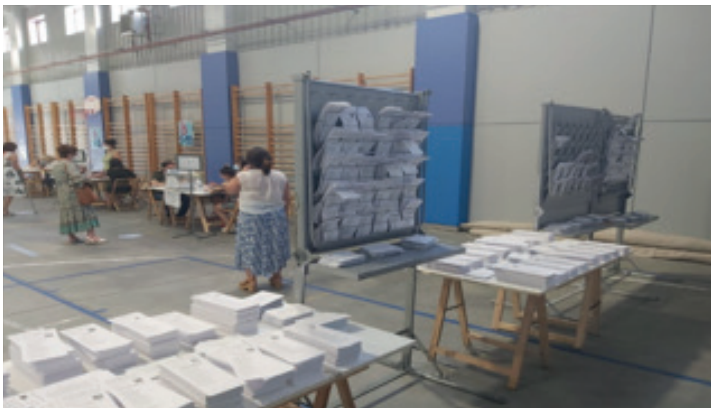
Centros de Votación en Vigo – Galicia