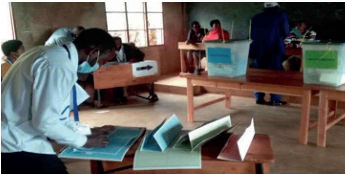
La autoridad electoral prepara boletas de votación durante las elecciones presidenciales, legislativas y comunales en Gitega, Burundi. 1