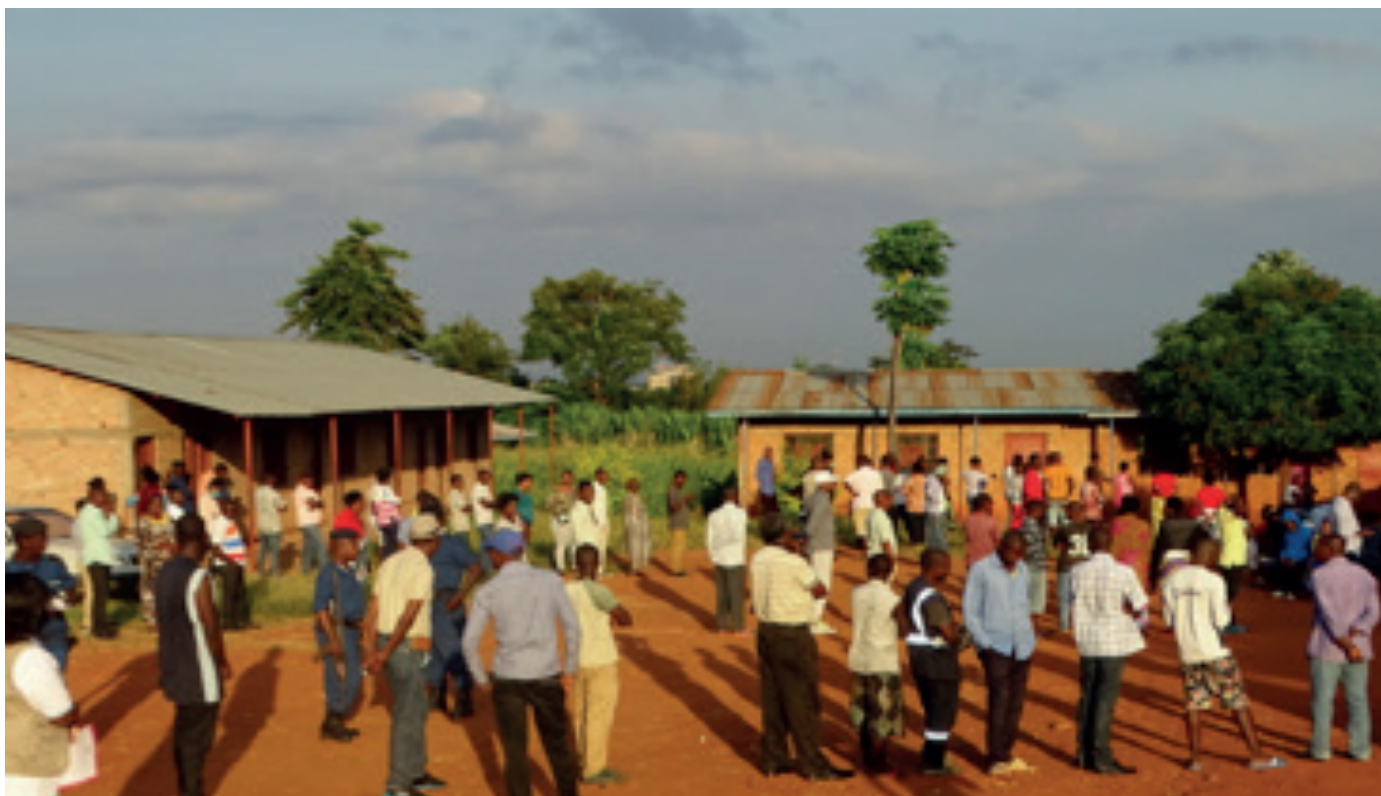
La jornada electoral del 20 de mayo en Bujumbura, Burundi. 2