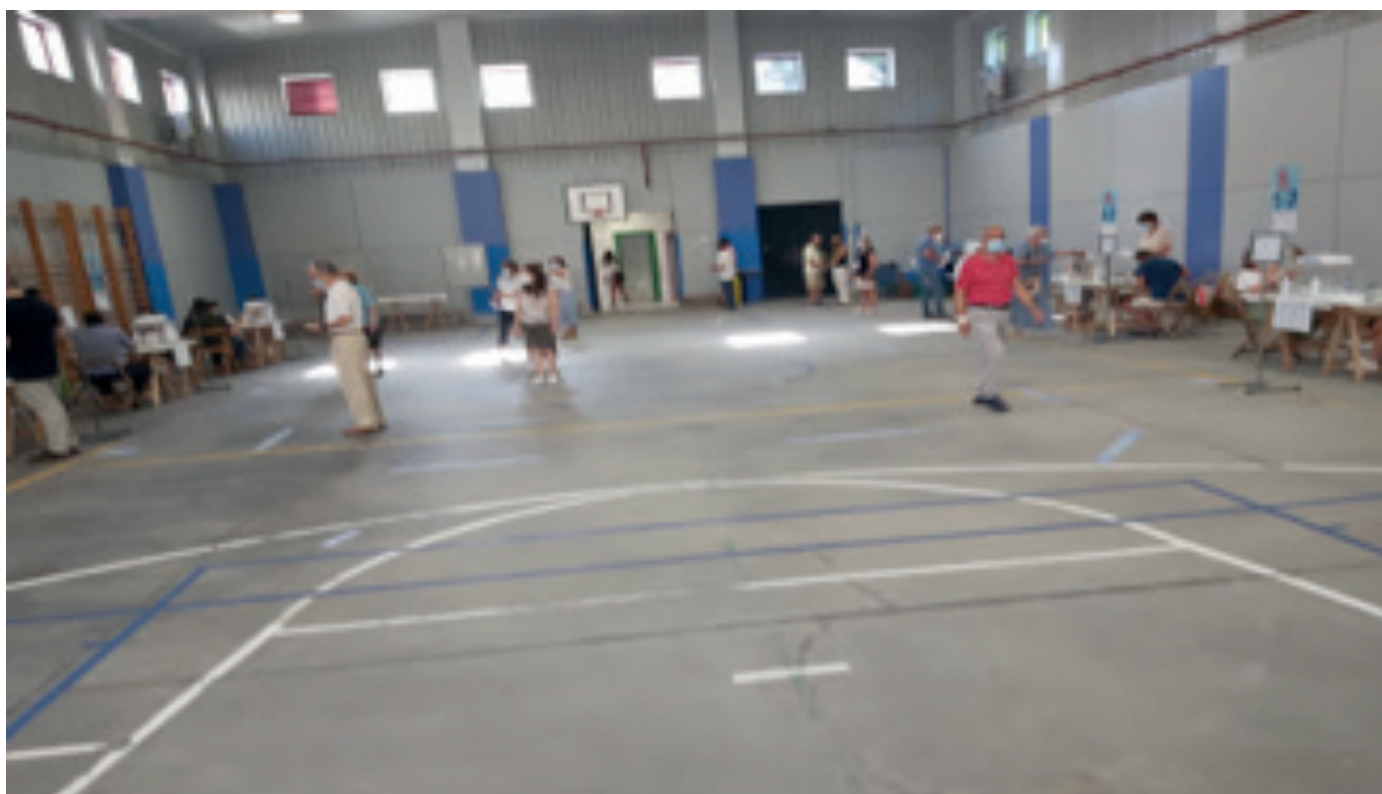
Centros de Votación en Vigo – Galicia