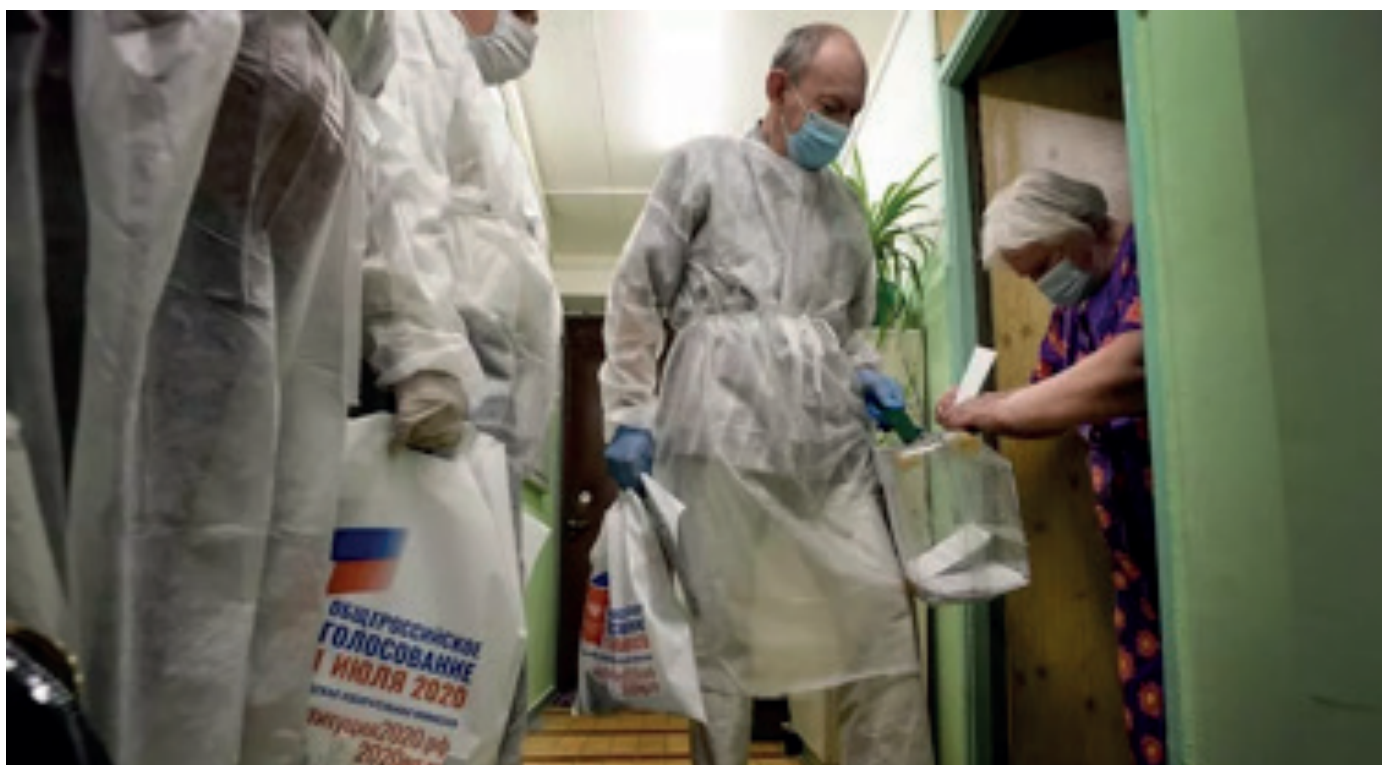
Una ciudadana deposita su voto en una urna móvil durante la votación anticipada en un referéndum constitucional. 5