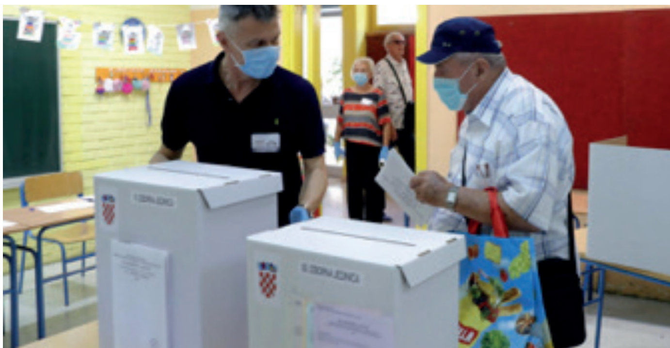
Los votantes usan máscaras faciales mientras emiten su voto para las elecciones parlamentarias croatas en medio de la pandemia de coronavirus en curso en un colegio electoral en Zagreb. 6