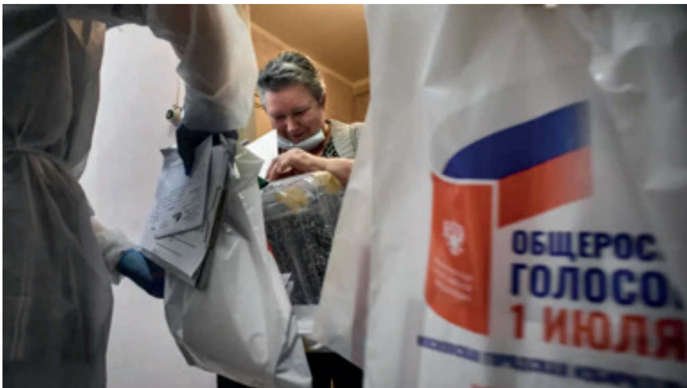
Una electora vota en el referéndum ruso depositando su papeleta en una urna móvil el 29 de junio de 2020 en su apartamento de Moscú. 4