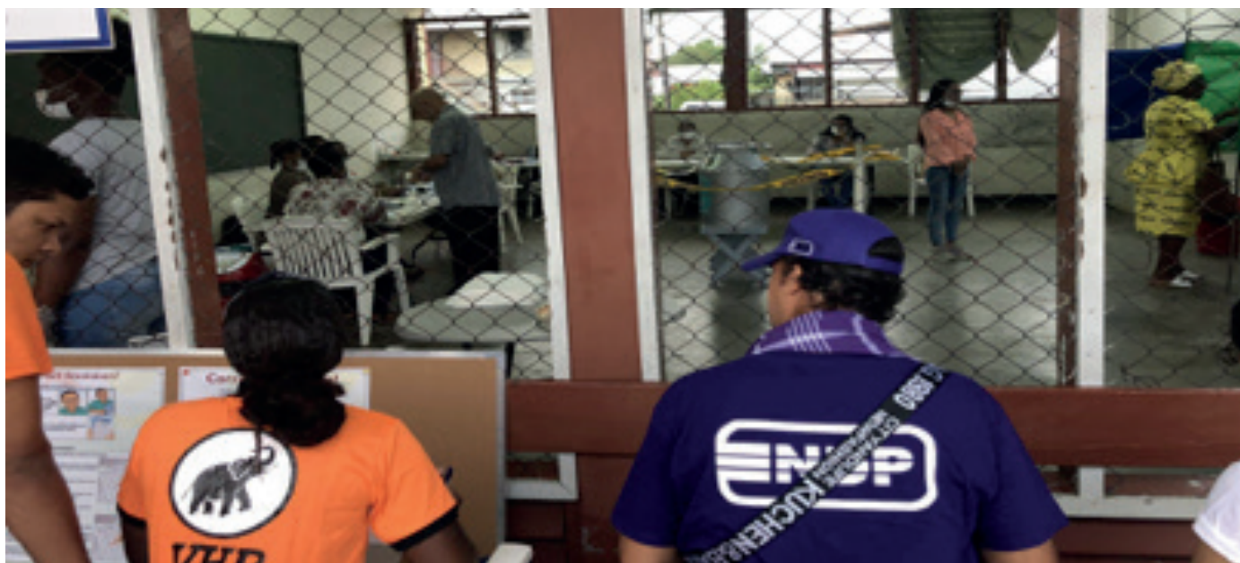
Fiscales partidarios observan el proceso de votación.