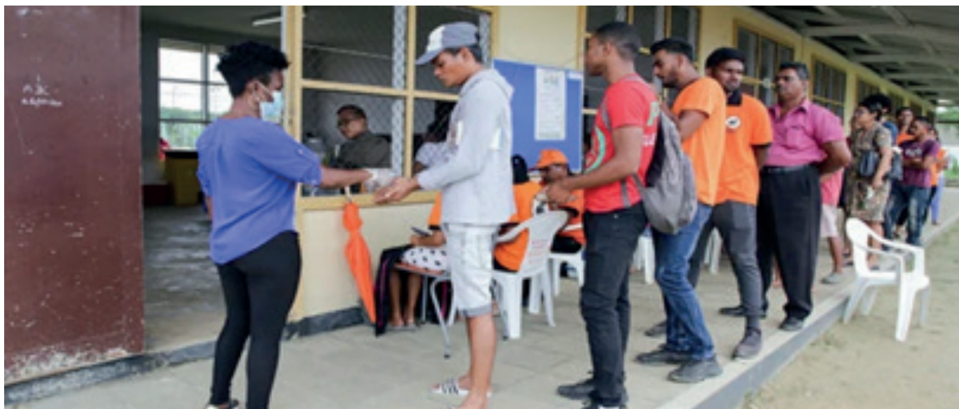
Electores desinfectan sus manos antes de ingresar a votar.